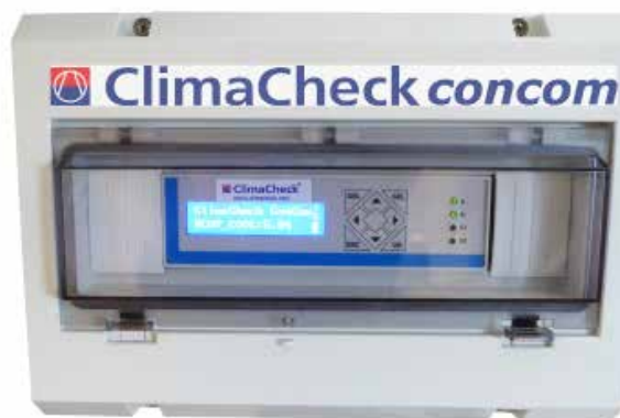
ClimaCheck concom DIN-Montering Art. No. 100970 Kommunikationsmodul med integrerat modem för dataöverföring. CE godkänd. I kapsling anpassad för applikationen

ClimaCheck concom läser data från moderna styrenheter på kylaggregat och värmepumpar. Protokoll är utvecklade för t ex Emerson kylaggregat men utvecklas succesivt för fler fabrikat. Data skickas till ClimaCheck online via inbyggt modem (LAN och WiFi-moduler är tillgängliga).